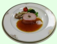
ポーク ヒレ肉のベーコン巻き ↓ライスサラダ 春の香り

また、目標達成のため、各人が何をやるかという決意表明を一人ひとり行いました。歓迎会では、食べ物のお話で盛り上がりました。