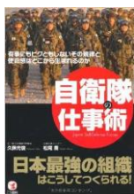
久保光俊 松尾 喬 著

先の東日本大震災が発生した直後、自身もしくは自らの家族が被災したにもかかわらず、自衛隊員は人命救助と復興に、おのれの命も顧みず、全力を尽くして立ち向かいました。